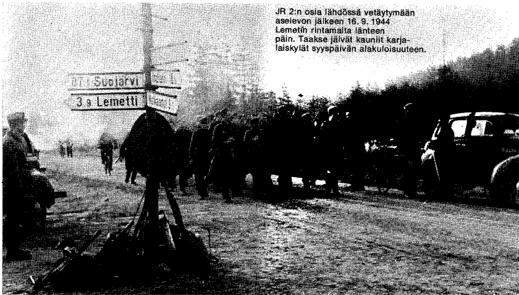
JR 2:n osia lähdössä vetäytymään aselevon jälkeen 16. 9. 1944 Lemetin rintamalta länteen päin. Taakse jäivät kauniit karjalaiskyliä syyspäivän alakuloisuuteen.

Joukot marssivat aamusta iltaan koettaen täyttää kunkin päivän marssimatkan, normin, johon äskettäin solmittu aseleposopimus velvoittaa. Taakse jäävät tutut kunnat, Lemetti, Koirinoja, Harlu, Pitkäranta, nimiä, paik-